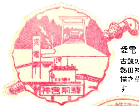
愛電 神宮前駅 古鏡のフレームに熱田神宮と駅舎を描き草薙の剣を配す