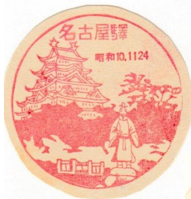
省線名古屋駅 昭和10.11.24 名古屋城