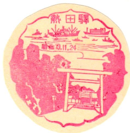
名鉄 神宮前駅案内所 愛電・名岐合併(昭和10年8月1日)以後